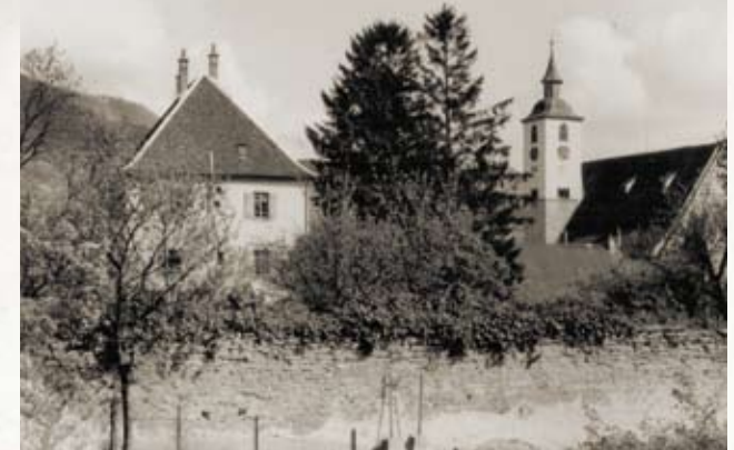
Schlößlepfarrhaus und Marienkirche, 1936

umgebaut und war als „Schlöble“ im Besitz verschiedener Adelsfamilien. 1786 wurde es Wohnsitz des Owener Stadtpfarrers und beheimatete u.a. Persönlichkeiten wie Eduard Mörike, der in Owen Vikar war, und Dr. Wilhelm Zimmermann, Historiker und Abgeordneter der Paulskirche. 1966 endete die Nutzung als Pfarrhaus. Seit 1990 ist hier die Musikschule untergebracht.