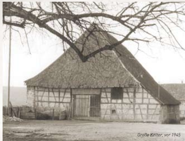
Große Kelter, vor 1945

Die Obere Kelter wurde um 1460 als Herrschaftskelter an der Stadtmauer erbaut. 1553 sind sieben Weinpressen belegt. 1842 schenkte das Königreich Württemberg die Kelter der Stadt, die sie wiederum den Weinbauern zur Nutzung überließ. In Owen wurde damals auf rund 55 Hektar Wein angebaut.