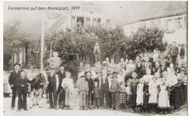
Fototermin auf dem Marktplatz, 1899

1905 wurde der aus dem 16. Jahrhundert stammende Marktbrunnen mit sechseckigem Brunnentrog abgebrochen.