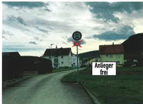
Verbindung Wasenweg – Im Brühl frei für Anlieger

A. WAGGERSHAUSER STRASSENBAU GMBH & CO KG STUTTGARTER STRASSE 87 73230 KIRCHHEIM-TECK