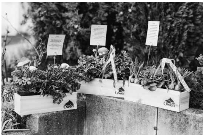
„Owen blüht gemeinsam auf“ © Blu Dolci Artwork

Vielen Dank an all die Beteiligten, besonders der VinoTeck und den Bürgern, die für den Erfolg der Aktion mit verantwortlich sind!